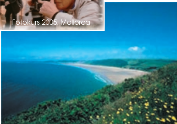
An der südenglischen Küste

Dann sollten Sie mit uns und dem Fotografen Mike Behrens auf Fototour durch das wunderschöne Südengland kommen. Es erwarten Sie idyllische Fischerorte, mittelalterliche Städte in faszinierender, abwechslungsreicher Landschaft: raue Küsten, grüne Hügel und natürlich fotografieren, fotografieren, fotografieren.