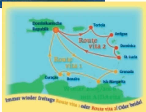
Die „gelbe“ Route Vita 1

Cocktail vor Curacao, herrliche Strandspaziergänge, Siesta auf dem Sonnendeck. Auf der AIDAvita erleben Sie den Zauber der Karibik ganz entspannt und individuell. Das liegt zum einen an dem reichhaltigen Bordangebot, das Leib, Seele und Sinne verwöhnt. Zum anderen werden Sie mit jeder Insel eine neue Facette der Karibik entdecken: ein Strand weißer als der andere, eine Bucht schöner als die andere. Ihr „Hotel“ erwartet Sie lächelnd in jedem Hafen - das Cluschiiff Aidavita.