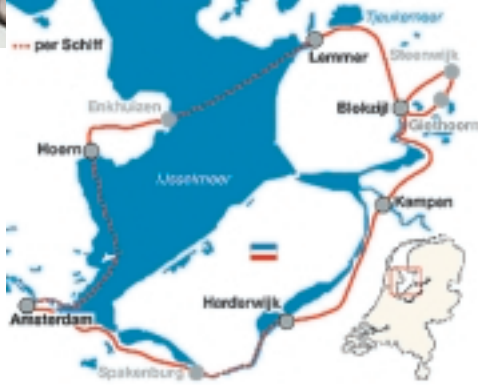
Die Ijsselmeer Rundfahrt

Glasklare Seen, von Bäumen gesäumte Kanäle, stille Grachten in denen sich schöne Giebelhäuser spiegeln, durchziehen das flache Land. Hin und wieder treffen Sie auf Hebebrücken, ein malerisches Städtchen oder Dörfchen und auf die für Holland so typischen Windmühlen. Sie wohnen auf typischen holländischen Hotelschiffen. Ihr Schiff fährt die gesamte Strecke mit, sodass Sie auch mal einen Tag an Bord bleiben können. Sie Radeln auf Radwegen und wenig befahrenen Nebenstraßen.