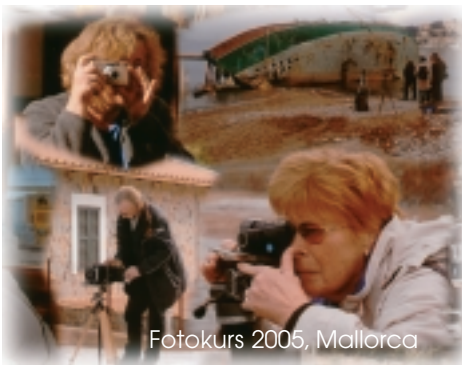
Fotokurs 2005, Mallorca

Sie fotografieren gerne? Sie würden diese Kunst gerne weiter entwickeln? Sie möchten das Gelernte in einer schönen Umgebung anwenden?